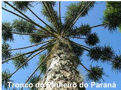
Tronco do Pinheiro do Paraná

Fora do Brasil, esta espécie foi introduzida em diversos países, entre os quais a África do Sul, a Austrália, o Quênia, Madagascar e o Zimbábue, com comportamento variável.