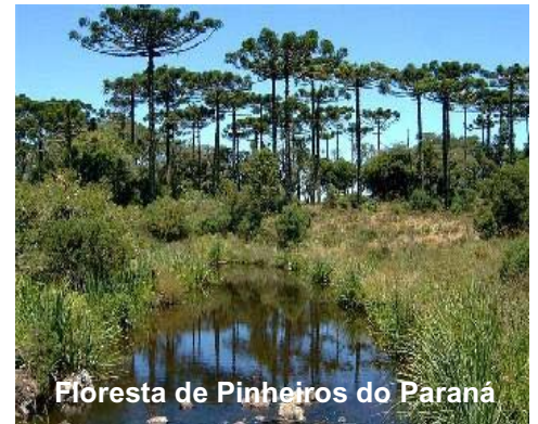
Floresta de Pinheiros do Paraná