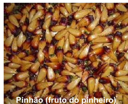
Pinhão (fruto do pinheiro)

A Gralha-azul foi adotada como Mascote de Orientação no Estado do Paraná.