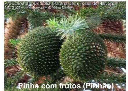
Pinha com frutos (Pinhão)