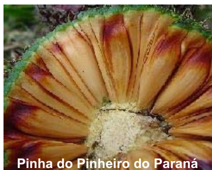
Pinha do Pinheiro do Paraná

Embora cientificamente não comprovado, muitas pessoas acreditam que a Gralha-azul "planta o pinhão" (semente do pinheiro). Na verdade, esta ave é considerada um agente dispersor em potencial das sementes do pinheiro. Durante a atividade de alimentação as gralhas transportam o pinhão de uma árvore para a outra, deixando muitas vezes cair a semente ao chão, a qual penetra no solo devido ao impacto da queda, vindo a germinar posteriormente.