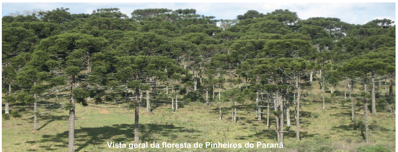
Vista geral da floresta de Pinheiros do Paraná

O Pinheiro-do-Paraná foi adotado pela FPO como símbolo da vegetação do Estado do Paraná.