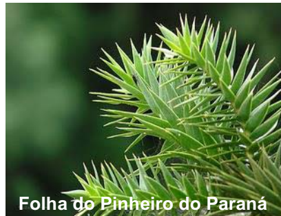
Folha do Pinheiro do Paraná