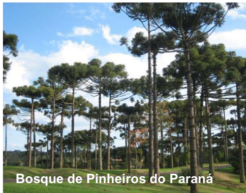
Bosque de Pinheiros do Paraná